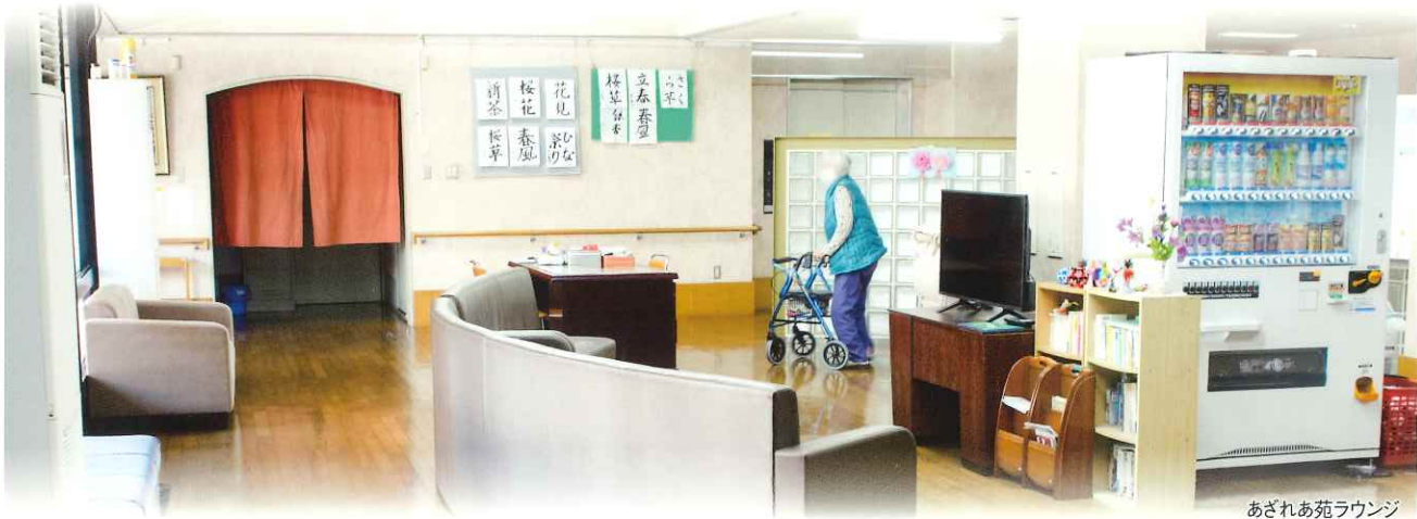
あざれあ苑ラウンジ

ケアハウスあざれあ苑は、高齢者の住まいとしての機能を重視したワンルームマンション型の入居施設です。食事、入浴はもちろん、日常的な健康管理や緊急時の対応、生活相談等のサービスをご本人の収入に応じて低料金でご利用頂けます。