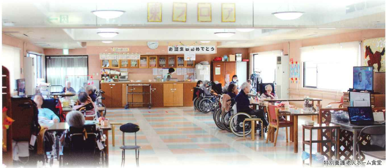
特別養護老人ホーム食堂

特別養護老人ホーム長生園は、高度な介護を必要とする高齢者の方が施設内で安心して暮らせる環境づくりを第一に考え、心をこめたケアを提供しています。また、当園では、ご本人らしく毎日をご過ごして頂けるよう、尊厳を大切に守り、笑顔で語り合える施設づくりを目指しています。