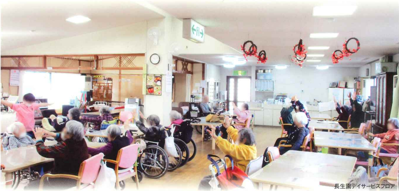
長生園デイサービスフロア

ご自宅で生活されている高齢者の方が、日中に安心して楽しく過ごせる場所をご提供いたします。 温かいお食事や入浴、季節の行事、趣味活動、リハビリテーションなどを通じて、心と体の健康をサポートします。介護が必要な方はもちろん、ちょっとした外出の機会が欲しい方にもご利用頂けます。