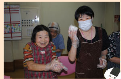
沢山おにぎり作りしました。 炭火焼きおにぎり本当においしかったです。