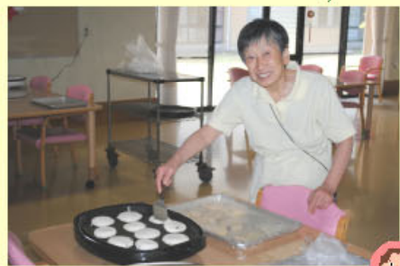
梅ヶ枝餅を母が自ら作りました。