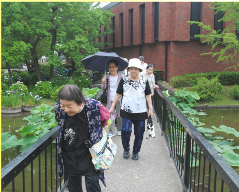
石橋文化センター 菖蒲の花見